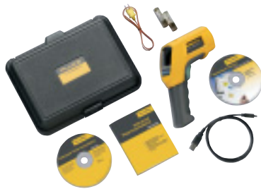
Fluke 568 a standardně dodávané příslušenství