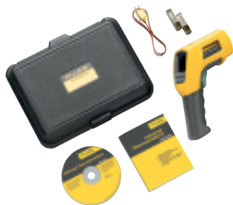
Fluke 566 a standardně dodávané příslušenství