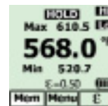
Zobrazení kompletních podrobností o měření během několika sekund