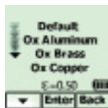
Výběr povrchu měření