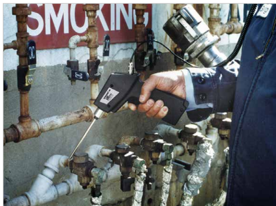
kontrola odváděčů kondenzátu

Ultraprobe® 100 má 8 polohový přepínač citlivosti s rozsahem 70 dB. Navíc je přístroj vybaven sloupcovým LED ukazatelem, kde každý stupeň odpovídá přibližně 3 dB – to je vhodné pro celkové stanovení hodnoty intenzity decibelů.