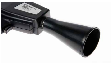
Modul pro velký dosah